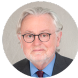
Prof. Dr. William A. Schabas Middlesex University London