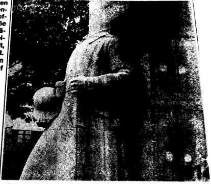
KOPFLOS ist derzeit das Ehrenmal an der Alten Bahnhofstraße in Langendreer. Unbekannte Täter entfernten den Kopf der Skulptur in der Nacht zum Donnerstag.

Das Ehrenmal wurde zum Gedenken der Opfer des Ersten Weltkriegs errichtet und ging in den 30er Jahren in die Obhut der Stadt über. 1968 wurden nach Ratsentscheid an der Säule des Denkmals noch zusätzlich die Bronzeziffern „1939-1945“ angebracht, so daß es fortan an die Opfer beider Weltkriege erinnerte.