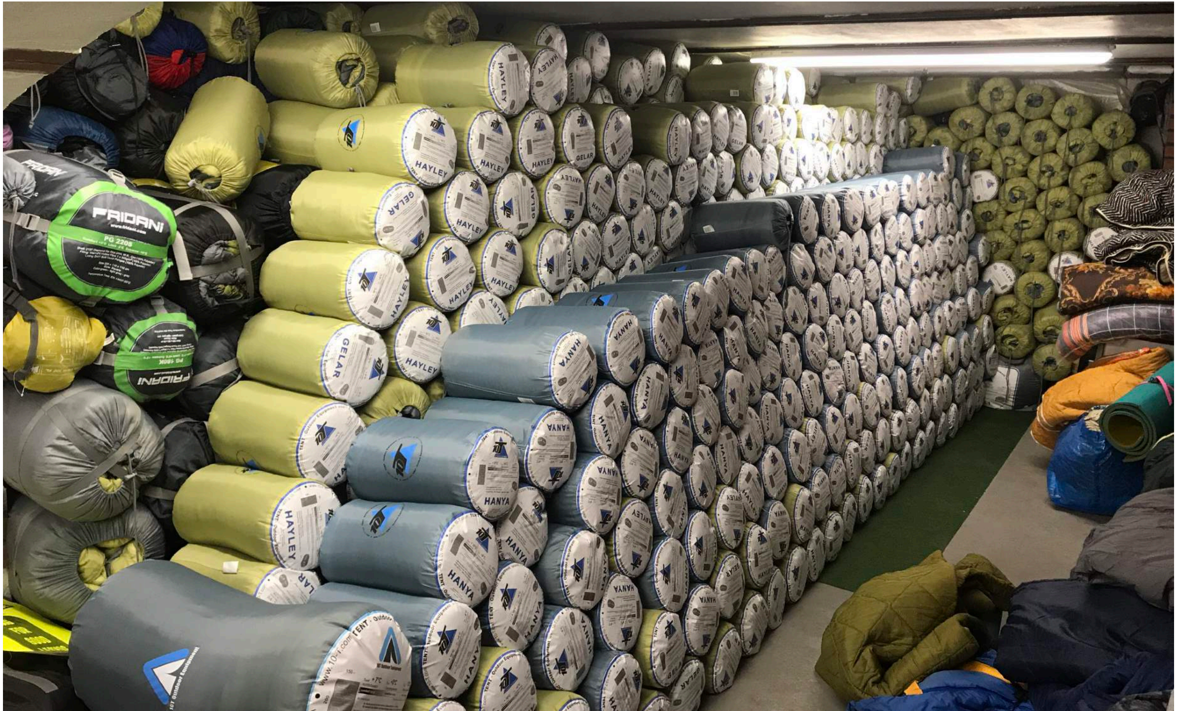
... das Lager in der KOFabrik nach vier Wochen.