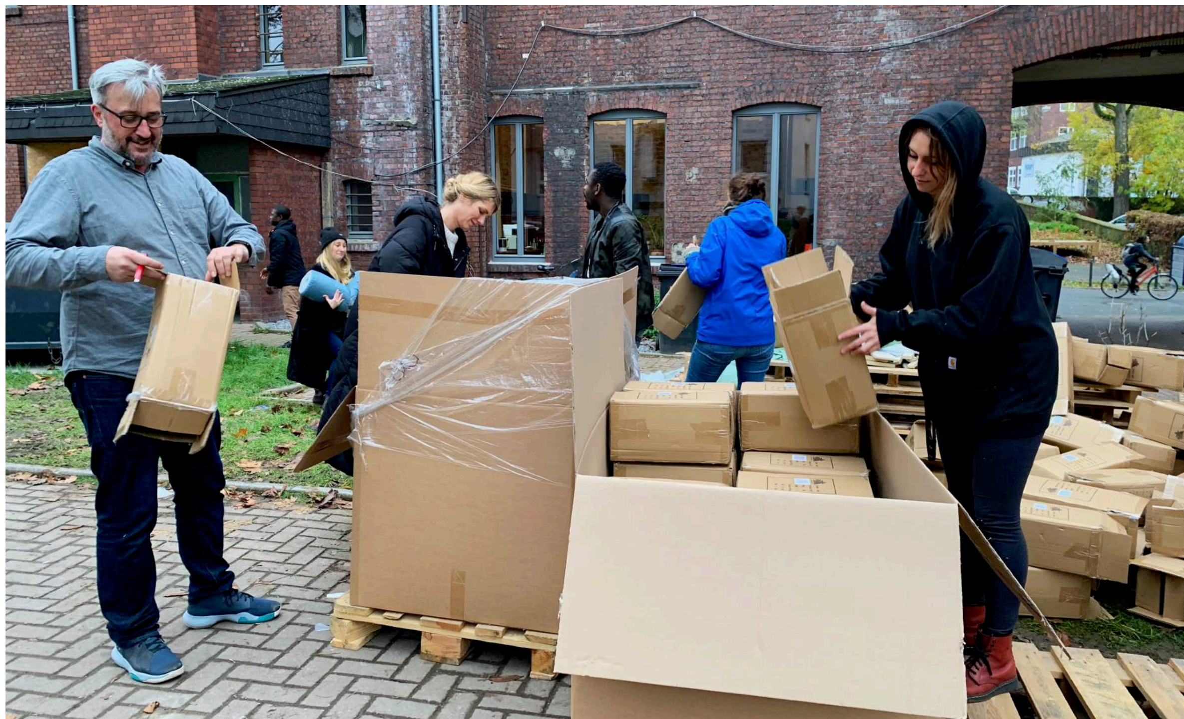
Anlieferung der gespendeten Schlafsäcke des Vereins Axia e.V.