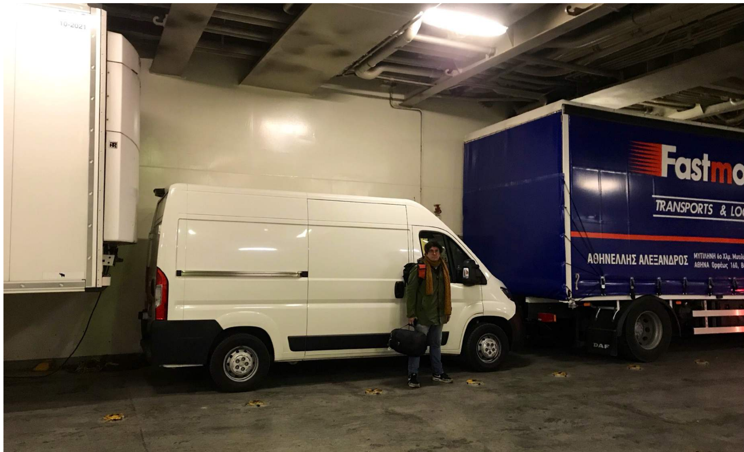
Einpark-Aktion auf der Fähre von Piräus nach Mytilini