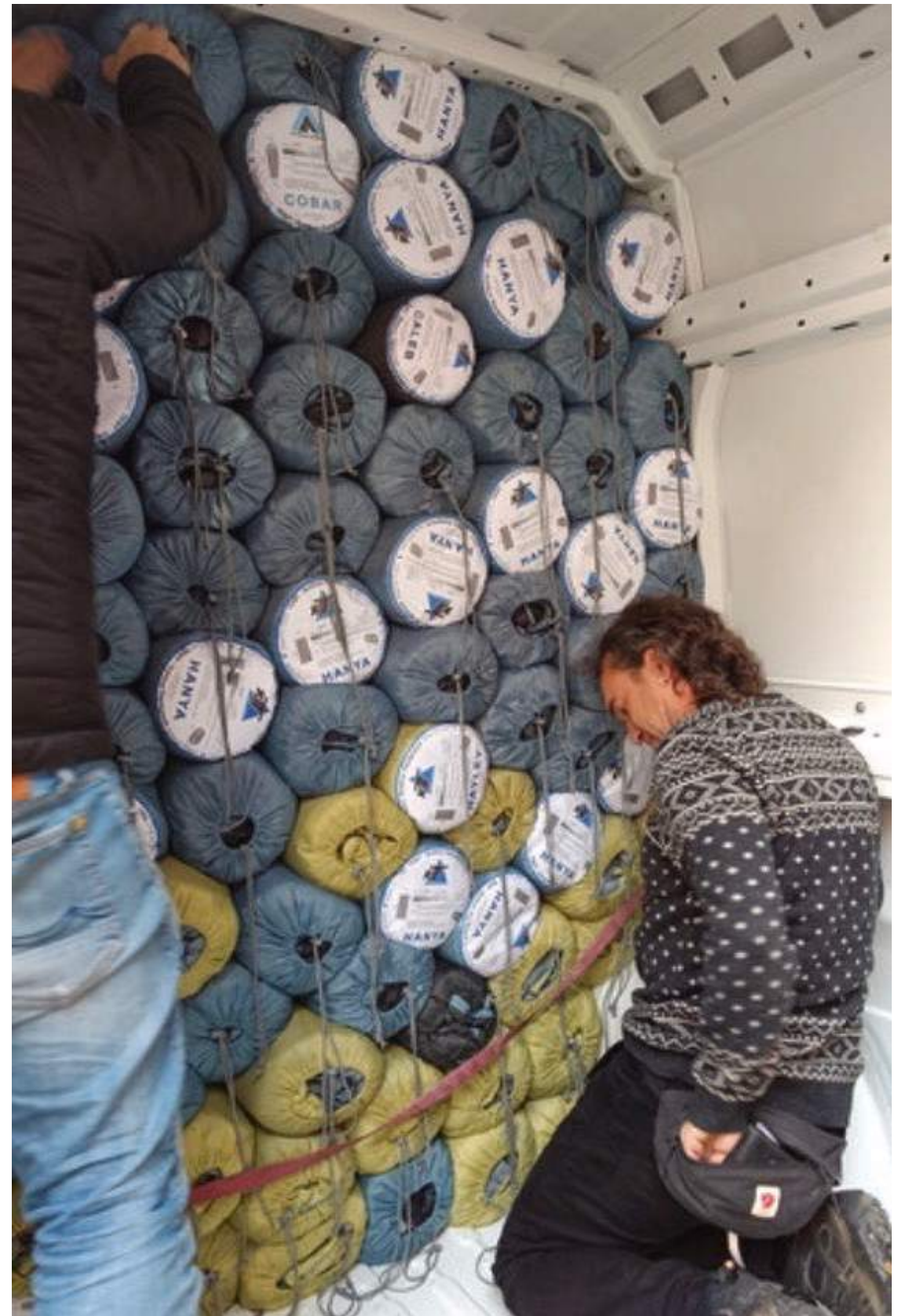
Helfer*innen beladen den Transporter für die Fahrt nach Lesbos