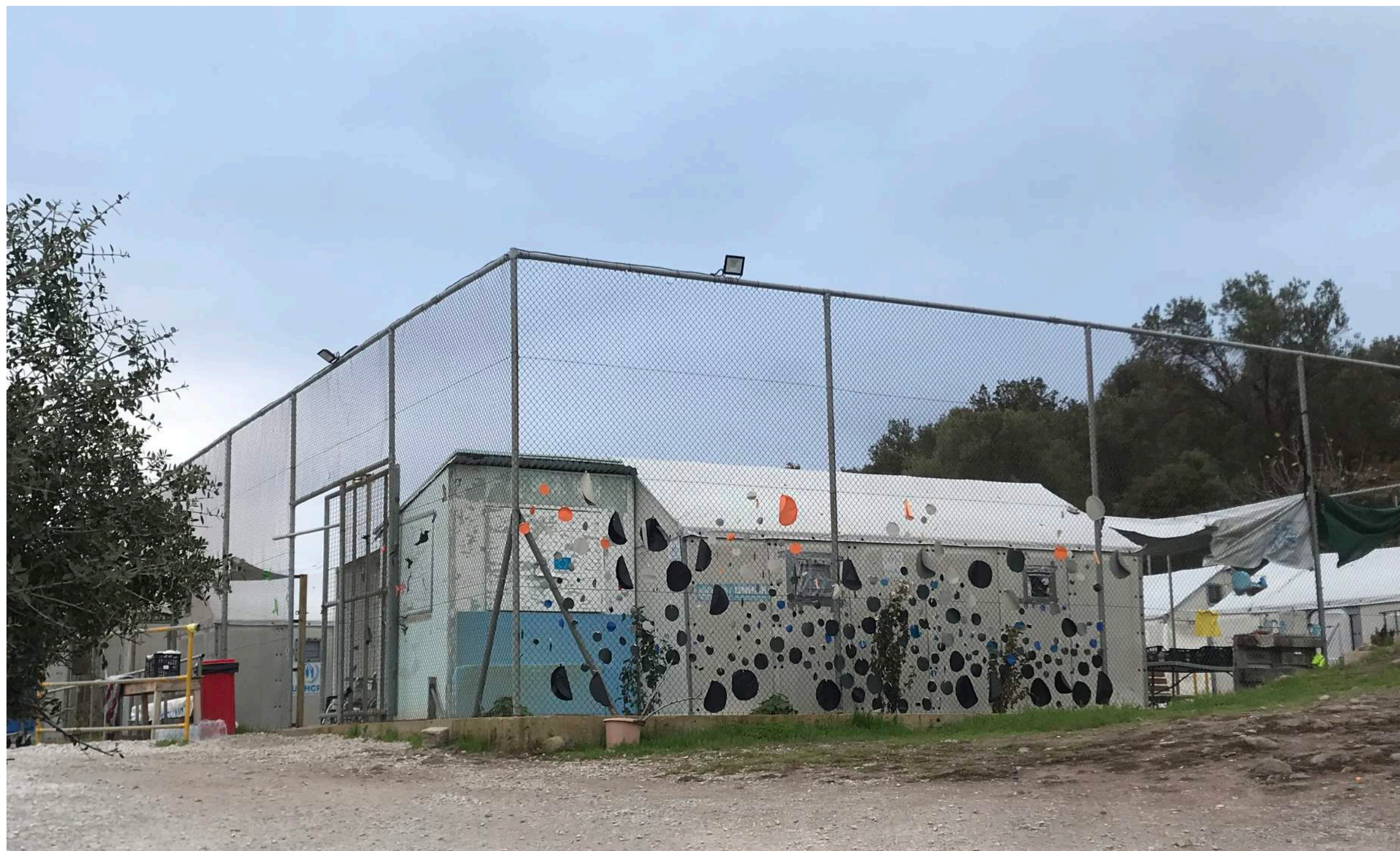
„Stage 2“, Erstaufnahmelager