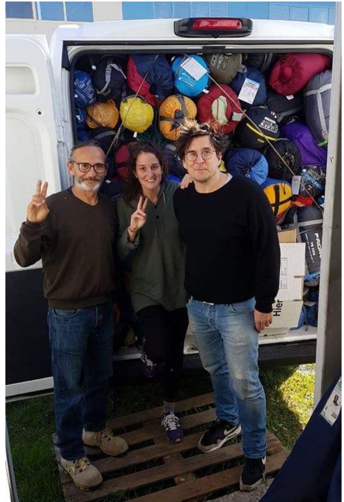
Anlieferung der Paletten bei Attika, Aris und unsereins beim Ausladen