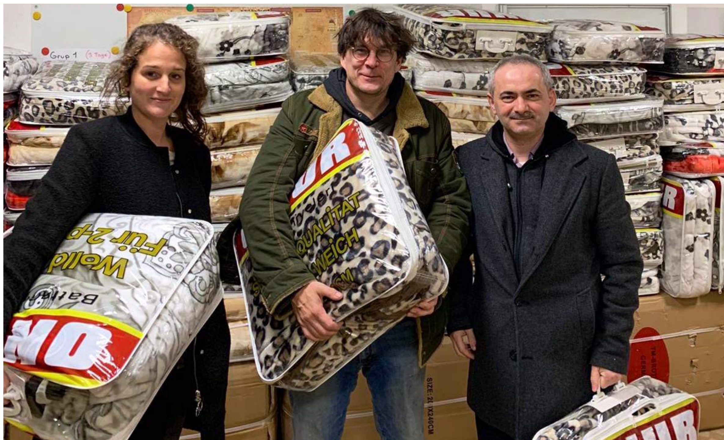
Abholung Decken-Spende bei der islamischen Gemeinde in Herne