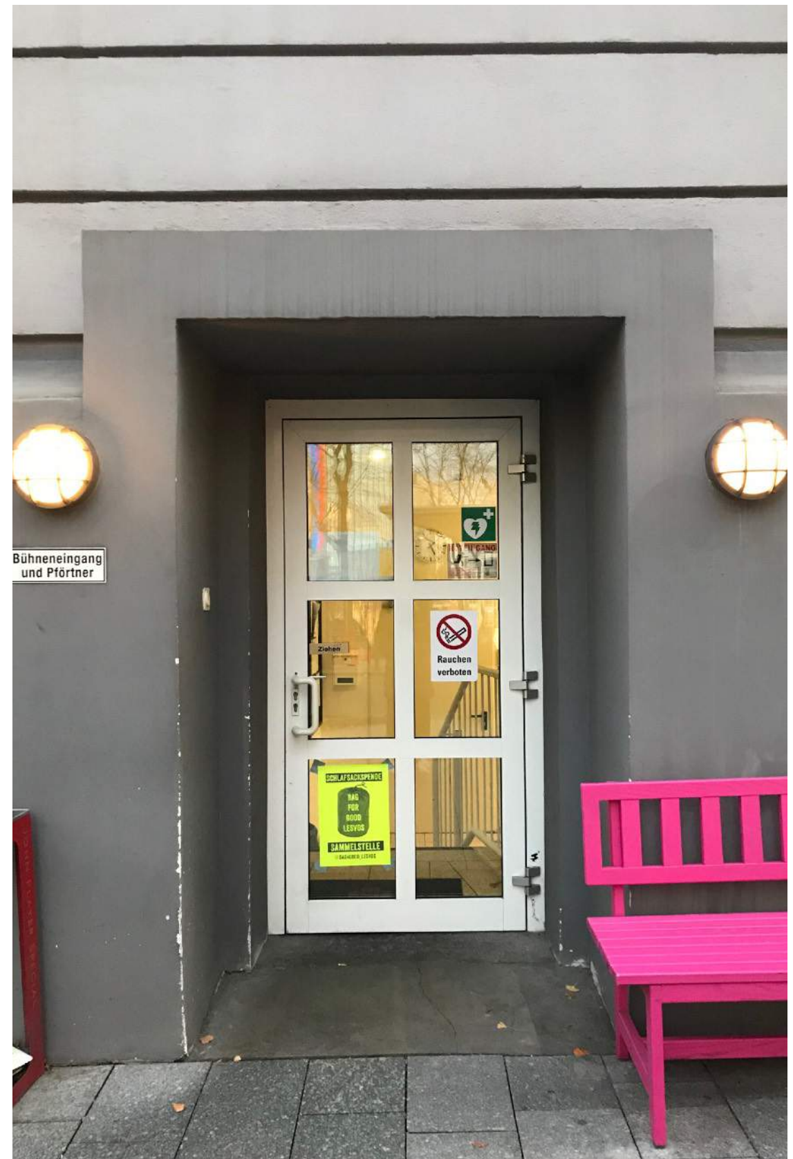
Schlafsack-Sammelstellen, Bochum und Essen