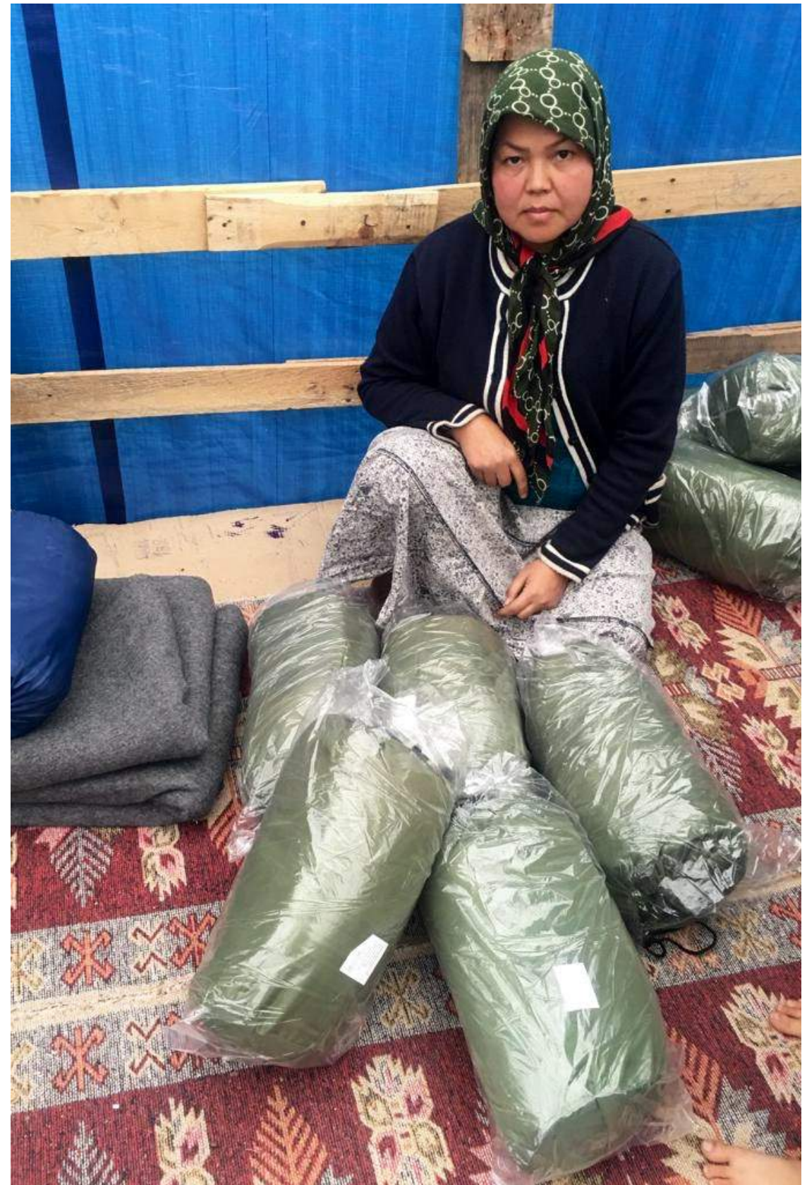
Verteilung der Schlafsäcke in den Olive Groves, Camp Moria