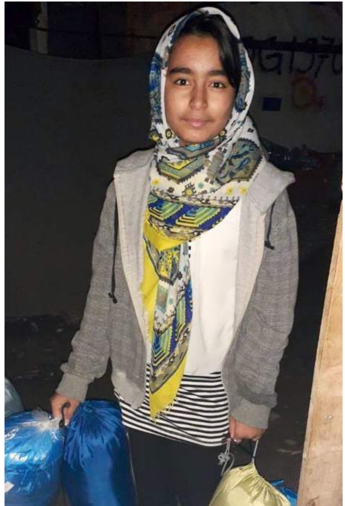
Verteilung der Schlafsäcke in den Olive Groves, Camp Moria