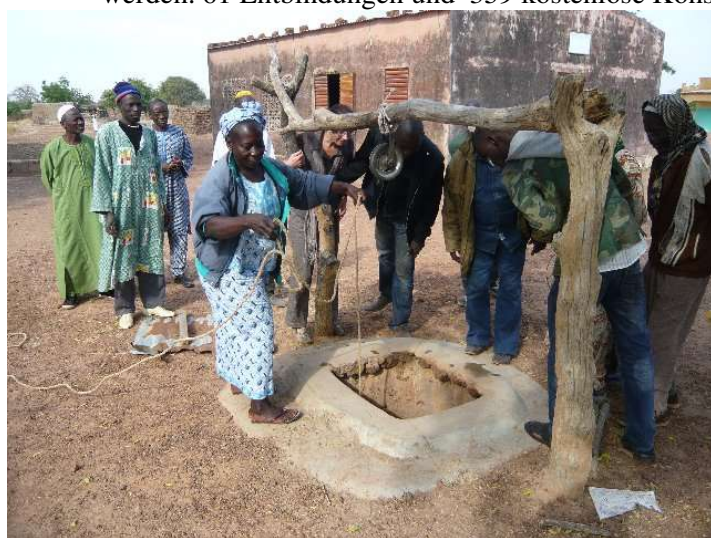
Der neue Brunnen – in Eigenleistung erstellt Im Hintergrund die renovierungsbedürftige Maternité

Die Finanzierung ist ja jetzt gesichert durch verschiedene Sponsoren. Das Projekt soll im April durchgeführt werden. 61 Entbindungen und 359 kostenlose Konsultationen in 2012