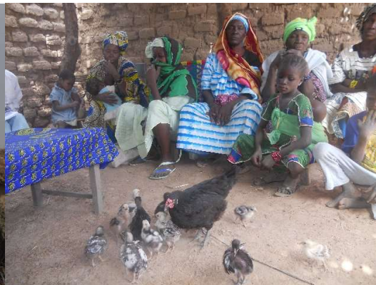
Besprechung mit der Frauenorganisation