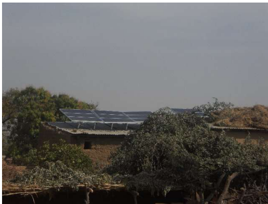
Solaranlage in Zeballa

Das über Kredit finanzierte Hühnerprojekt hat erst im August nach der Feldarbeit wirklich angefangen. Es gibt ein Haus mit Kühlschrank, Batterien und Brutschrank, oben sind 9 Solarpanells installiert, alles das wurde über Kredit gekauft. 2 große Rückschläge gab es gleich zu Beginn: 15 von 30 Zuchthähnen aus Bamako sind auf dem Transport verstorben (180 €). Durch Ausfall eines Solarpanells sind 260 befruchtete Eier im Brutschrank kaputtgegangen (Verlust ca. 100 €). Jetzt fehlt das Geld, um ausreichend Impfstoff und Hähne nachzukaufen (und Einnahmen wurden noch nicht erzielt). Sie bitten um Unterstützung. Da das Projekt mit 6 Monaten Verzögerung begonnen hat, habe ich zugesagt, dass die Rückzahlung des Kredits entsprechend gestreckt wird. Zum Kauf von Impfstoffen wird ein einmaliger Zuschuss von 500 Euro zugesagt. Dies rief große Erleichterung hervor. Viele Frauen haben die Teilnahme zurückgezogen, da ihnen nach den Rückschlägen das Risiko zu groß erscheint. Es nehmen nur 18 statt 50 Frauen teil. Und dabei hat Oumar schon 4 Wochen Urlaub geopfert, um das Projekt ans Laufen zu bekommen. Jetzt ist es auf einem guten Weg. In Zeballa ist ein Dispensaire und eine Maternité neu gebaut worden, wir versprechen Hilfe bei der Ausrüstung, der Leiter der Station wird uns eine Liste dazu erstellen.