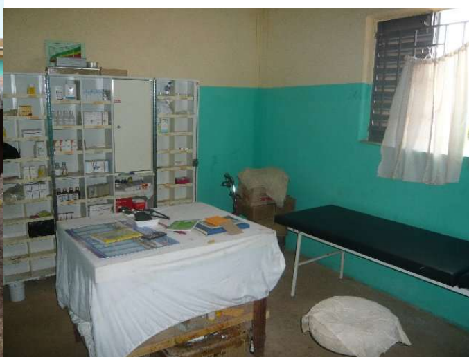
Adama Traorés Schmuckstück - das Dispensaire, Unsere Spenden machten es möglich