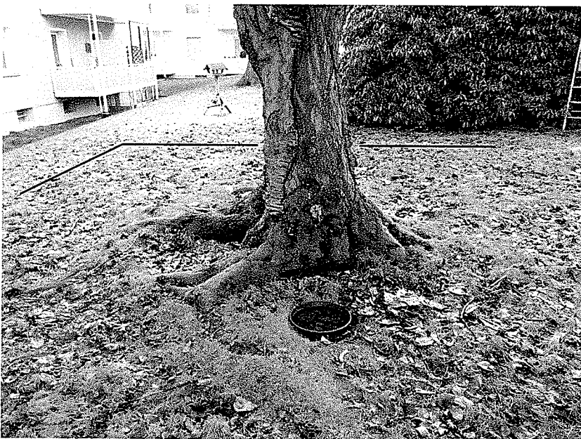
Abbildung 4 Die Aufnahme zeigt sehr gut den auffallend flachen Abgangswinkel der Wurzelanläufe. Die schwarzen Linien deuten an, auf welchen Seiten baulich eingegriffen wird.