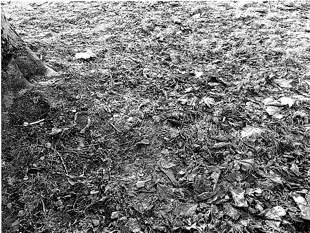
Abbildung 6 Auch bei der Rosskastanie wurden vermeidbare Mähschäden festgestellt. Hier nur einige, mit roten Pfeilen markiert.