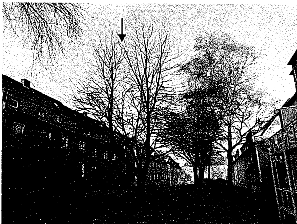
Abbildung 1 Untypischer und asymmetrischer Habitus - mehrere Ursachen möglich.

8.1.1 Bei diesem Baum handelt es um ein handwerklich nicht gelungenes Exemplar von Prunus avium , „Kanzan“.