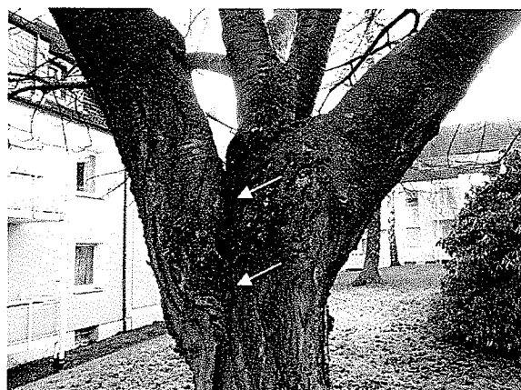
Abbildungen 2 und 3 Die Pfeile markieren die biomechanischen Schwachstellen.