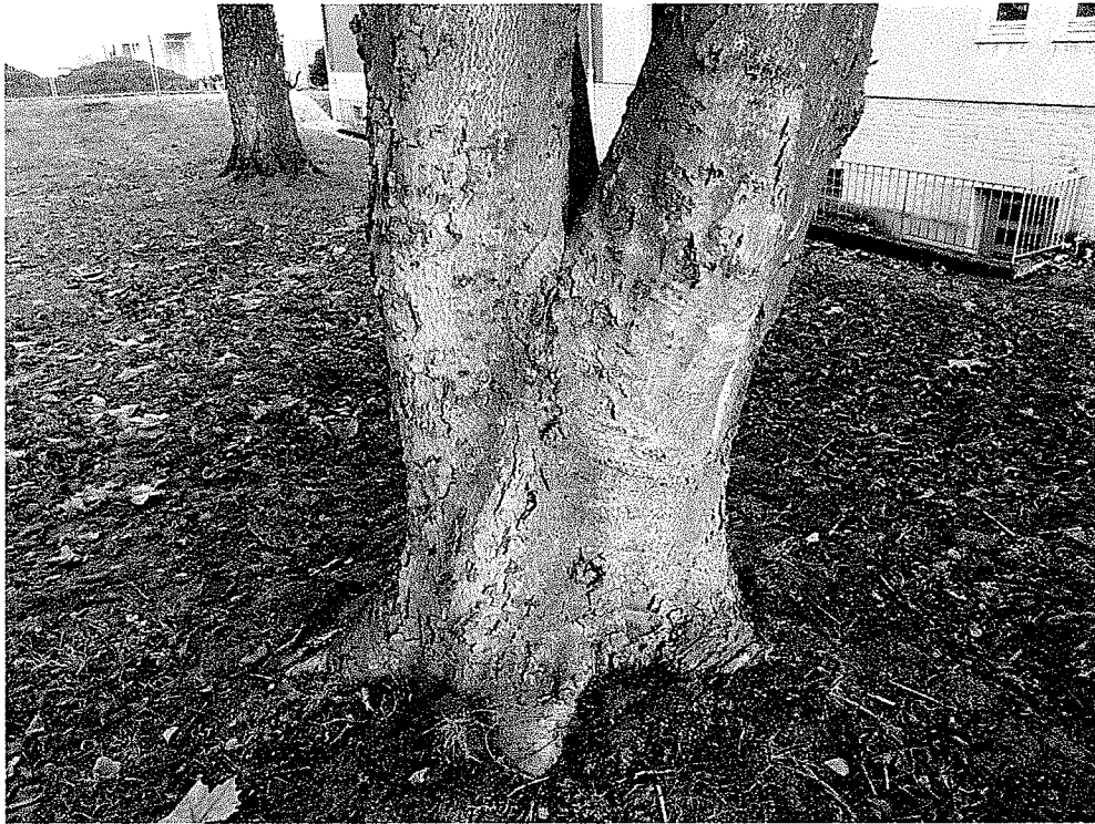
Abbildung 5 Kräftige Wurzelanläuferausbildung in Richtung Wiesenzentrum, jedoch nicht in Richtung Bauvorhaben.

8.2.6 Erforderliche Maßnahmen: a) Vor Beginn und für die gesamte Dauer der Baumaßnahme ist ein Bauzaun zu installieren (wie vor Ort besprochen), um den Standort der Rosskastanie vor Verdichtung und Kontamination zu schützen. b) Auf der Wiese darf nichts abgelagert und nicht gefahren werden. c) Sämtliche Baubewegungen sind von unten zu realisieren (wie vor Ort besprochen). d) Auf der dem Baugeschehen zugewandten Seite ist ein Mindestabstand, zum Stammfuß, von 2,5 Metern einzuhalten. e) Gegebenenfalls unumgängliche Wurzeldurchtrennungen dürfen nicht mittels Schippe, Spaten oder Baggerlöffel erfolgen, sondern sind mit einer scharfen Handsäge durchzuführen. f) Durchtrennte Stellen dürfen nicht der Austrocknung preisgegeben werden, sondern sind geeignet zu schützen.