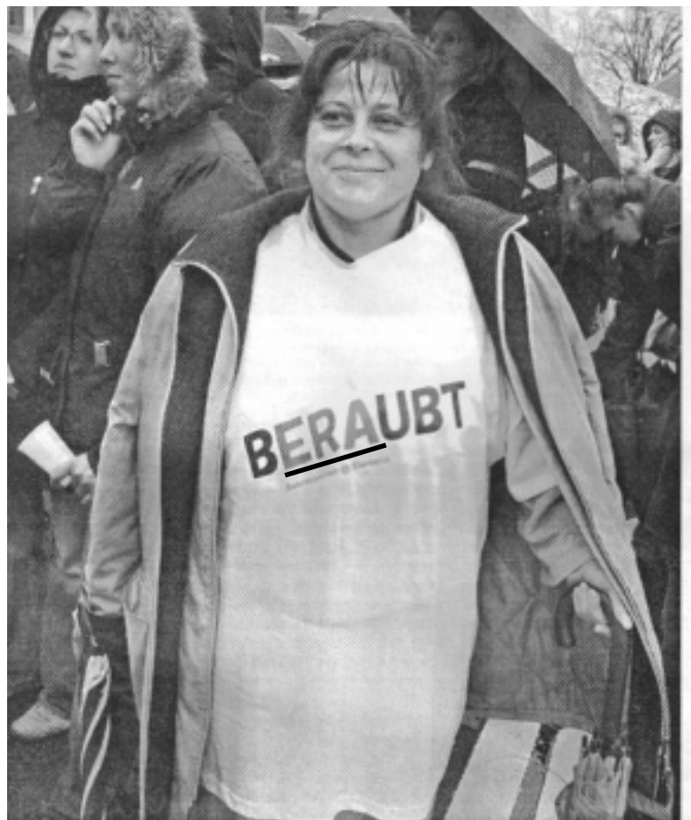
Was die Arbeiterinnen und Arbeiter über ERA denken, zeigten Sekretärinnen und Teamarbeiterinnen am 7. Dezember vor der Siemens-Hauptverwaltung in Erlangen. Sie protestierten gegen ihre Herabstufung durch ERA (Entgeltrahmenabkommen). Durchschnittlich macht die Herabstufung bei Sekretärinnen 600 Euro aus, in etlichen Fällen sind es zwischen 1.000 und 1.500 Euro im Monat.