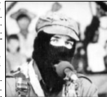
Spricht eine andere Sprache als die des Scheiterns der Verbindung von nationaler und sozialer Emanzipation: Subcomandante Marcos (EZNL)